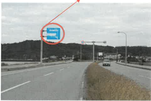
スタートより「1.5km地点」表示あり