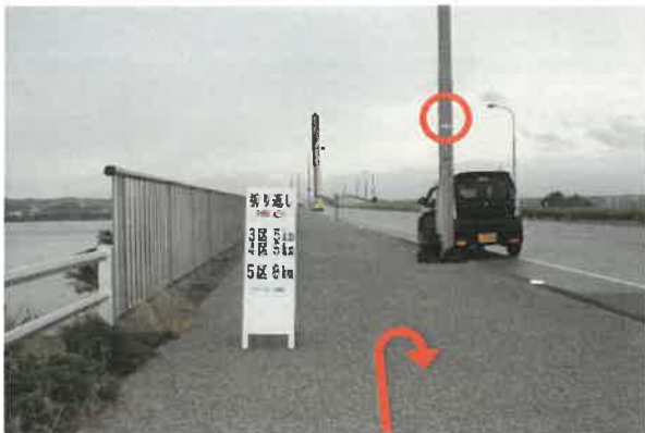
「5区」折り返し (スタートより1.0km地点) ロードパーク入口標識折り返し