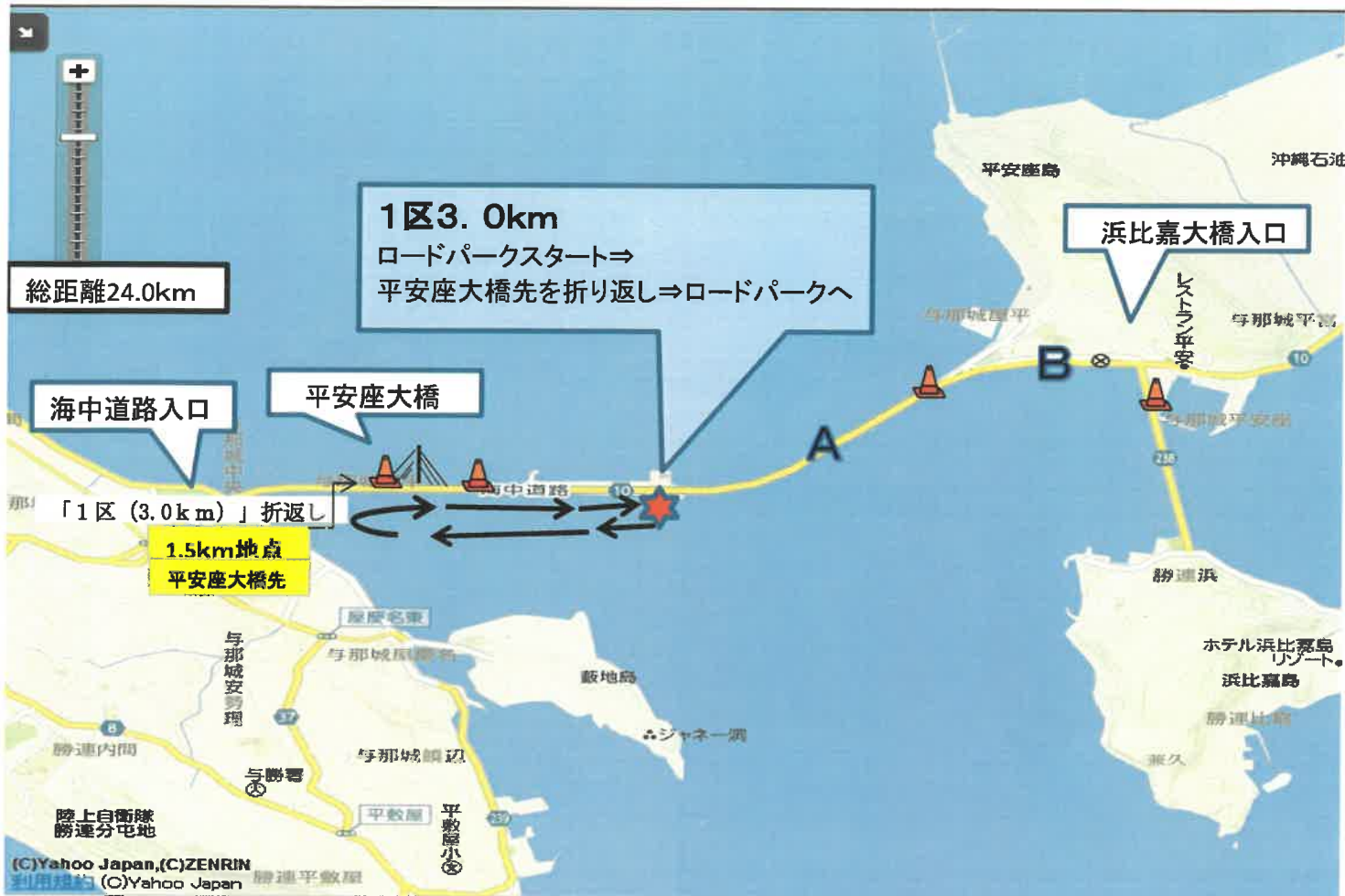
「1区」折り返し (スタートより1.5km地点) 平安座大橋先