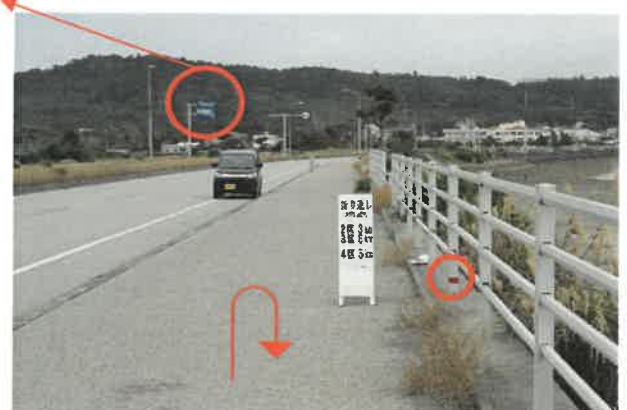
街灯「赤」・柵「赤・みどり・黒」テープ表示