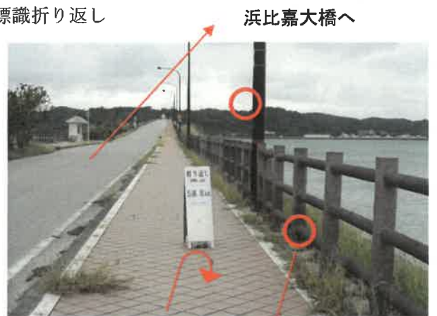
街灯「赤」・柵「赤・みどり・黒」テープ表示あり