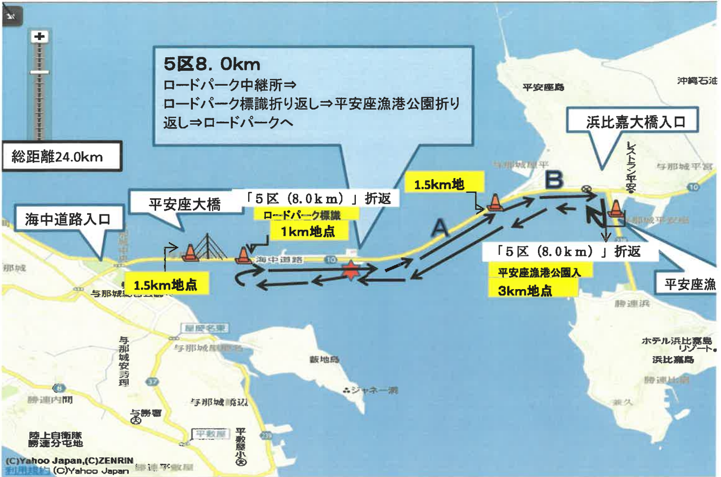
「5区」折り返し (スタートより3.0km地点) 平安座漁港公園入口折り返し