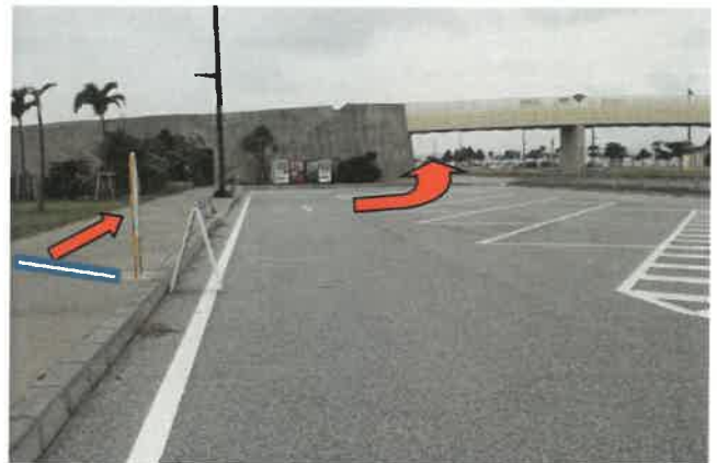
ロードパーク内(歩道) 「スタート・ゴール・中継所」