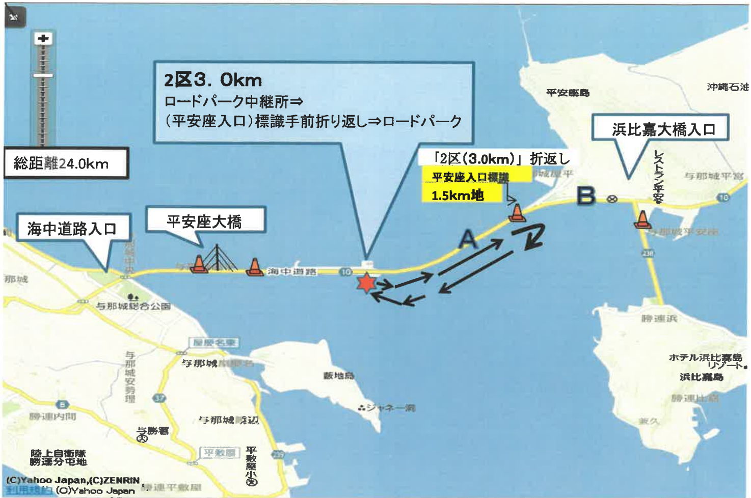
「2区」折り返し (スタートより1.5km地点) (平安座入口) 「伊計島/宮城島入口」標識手前折り返し (平安座入口) 標識