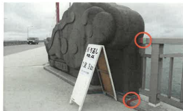
スタートより「1.5km」折り返し表示